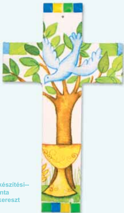
Elkészítési- minta fakereszt

A szalvétatechnika egy nagyon közkedvelt eljárás, amellyel egyszerű tárgyakból kisebb műalkotások varázsolhatóak. A kisebb kezek is sikeresek ezzel a technikával.