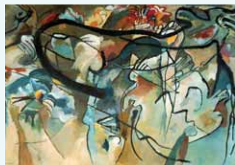
Wassily Kandinsky „Composition V“, 1911

„Mit ábrázol ez egyébként?“ Az absztrakt művészetet tárgyiatlan művészetnek is hívják, mert gyakran nem ismerhetőek fel tárgyak. Az orosz festő Wassily Kandinsky az első absztrakt kép megalkotójának számít a világon. Amikor 1911-ben, Münchenben szeretett volna kiállítani, a zsűri a „Komposition V“ nevű alkotását elutasította. Időközben számos követője van ennek a művészeti irányzatnak.