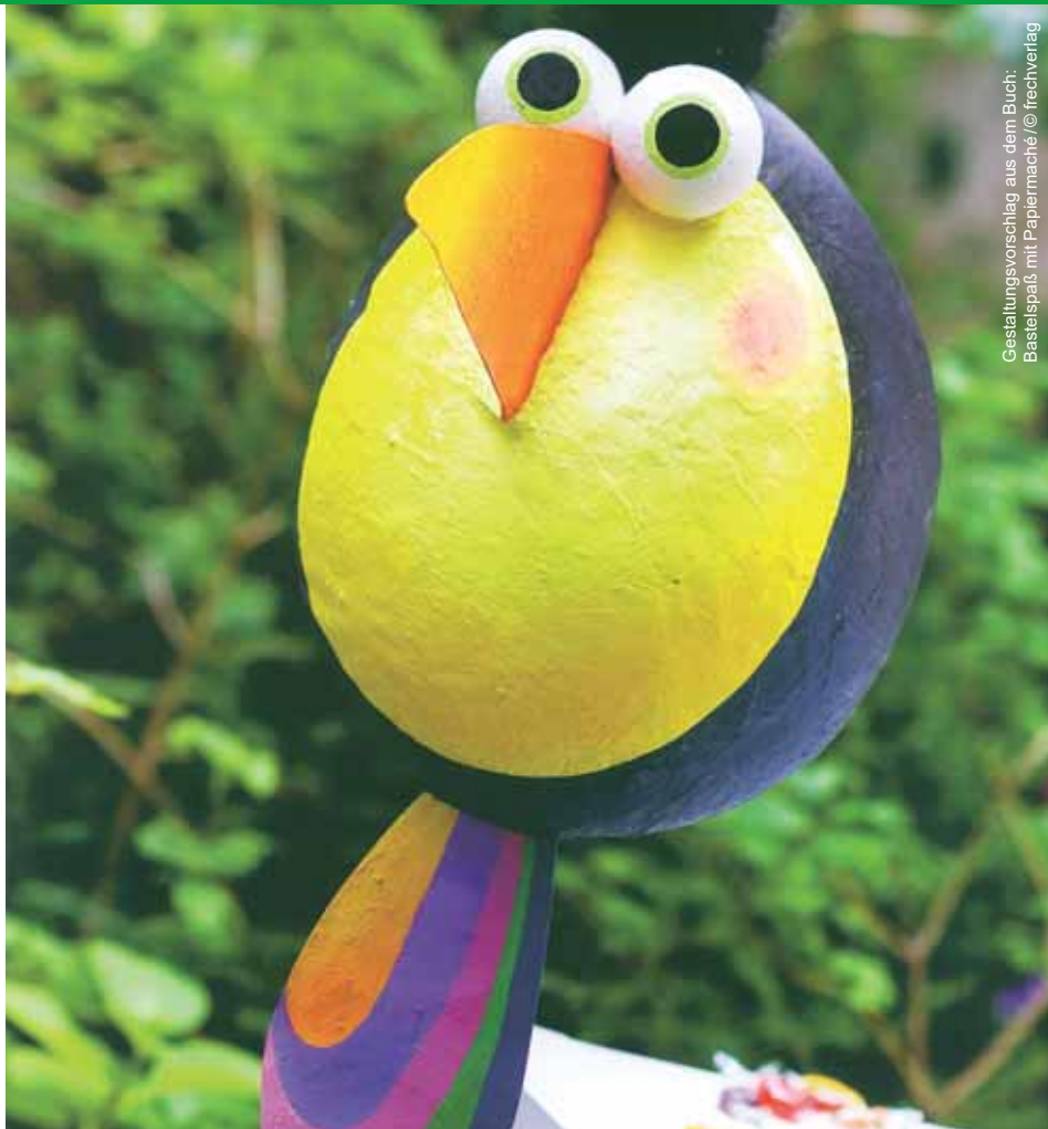
Gestaltungsvorschlag aus dem Buch: Bastelspaß mit Papiermaché