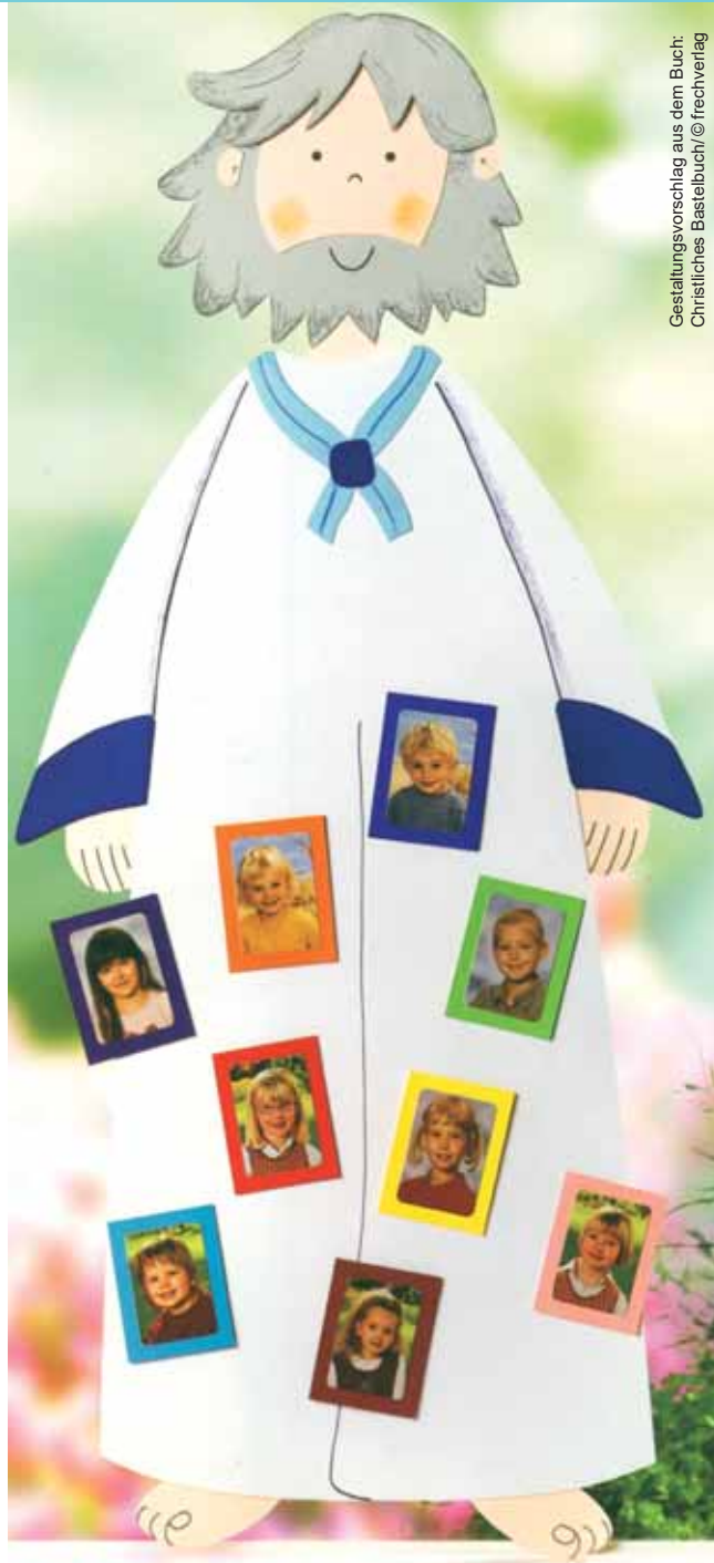
Gestaltungsvorschlag aus dem Buch: Christliches Bastelbuch

Als Jesus vor einer großen Menschenmenge sprach, wollten einige Leute ihre Kinder zu ihm bringen und sie segnen lassen. Die Jünger versuchten, die Leute fernzuhalten, aber Jesus sprach: „Lasst die Kinder zu mir kommen, hindert sie nicht daran! Denn Menschen wie ihnen gehört das Himmelsreich.“