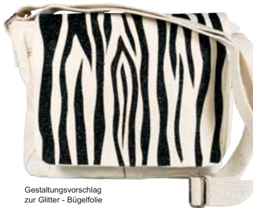
Gestaltungsvorschlag zur Glitter - Bügel folie

Gold-18, Kirschrot-30, Rosa-40, Himmelblau-61, Lavendel-75, Schwarz-90, Silber-92 Farbnummern bitte angeben! 2318 .. per Stk. ....4,99