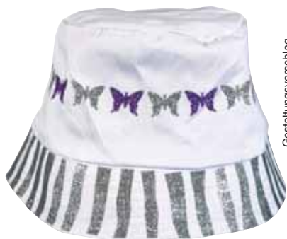
Gestaltungsvorschlag zur Glitter - Bügel folie