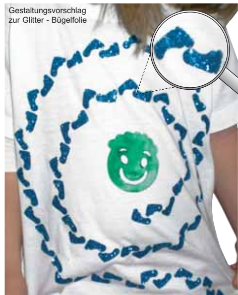
Gestaltungsvorschlag zur Glitter - Bügel folie

Ein umfangreiches Strassstein - Sortiment finden Sie im Hauptkatalog auf Seite 336-337.