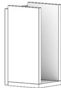
Skizze 1 Hohe Aufbewahrungsbox